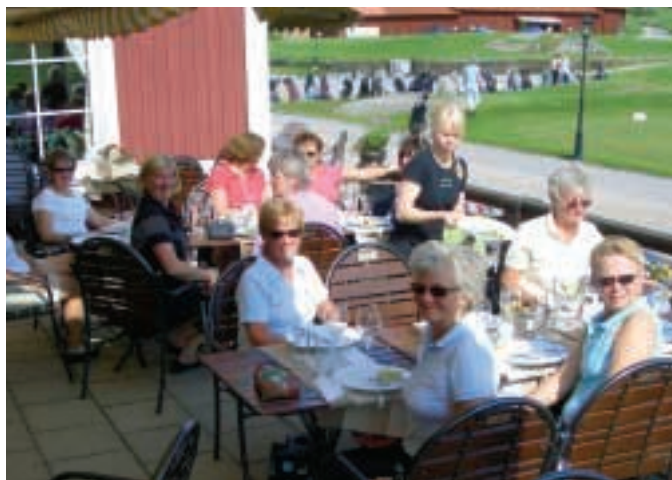
Förväntansfulla damer inför prisutdelningen.