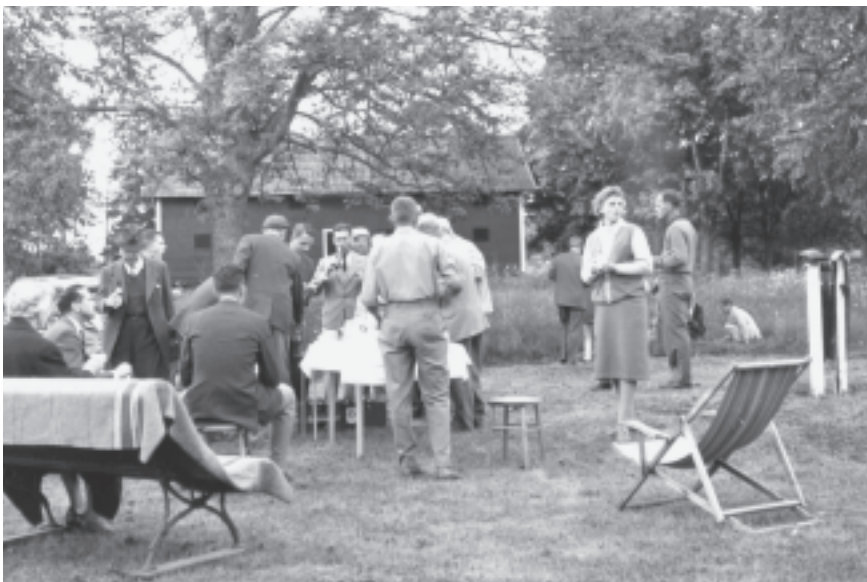
Efter de första ronderna på UGK:s nya 18-hålsbana på Håmö var det Garden Party med korvgrillning m.m. Foto från 8 augusti 1964.

Matrikeln kan hämtas i slutet av maj i receptionen.