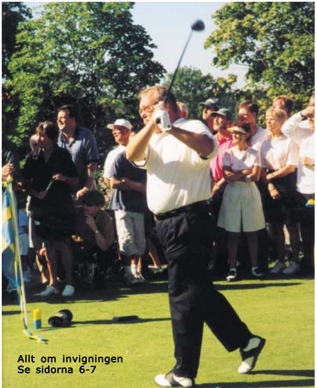
Allt om invigningen Se sidorna 6-7

Håmöbladets 40-åriga historia. Läs mer på sid 4