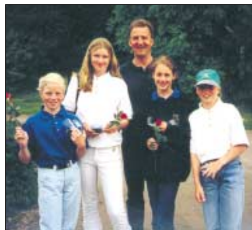
UGK:s flicklag i Tjejesatsningen 2001, regionsfinal på Fullerö.